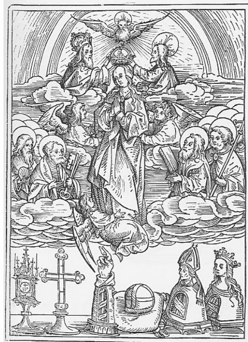
Auswahl der gefassten Reliquien, Holzschnitt im Haller Heiltumbuch 1509/10

Ritter Florian Waldauf , enger Vertrauter von Kaiser Maximilian I., legte eine riesige Reliquiensammlung an, die er 1501 von Schloss Rettenberg in einer großen Prozession nach Hall in die Waldaufkapelle (in der Pfarrkirche) übertragen ließ. Heute ist nur mehr ein kleiner Teil davon erhalten.