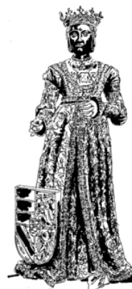
Bianca Maria Sforza (zweite Ehefrau)