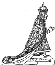
Kaiser Maximilian I. auf dem leeren Grabmal