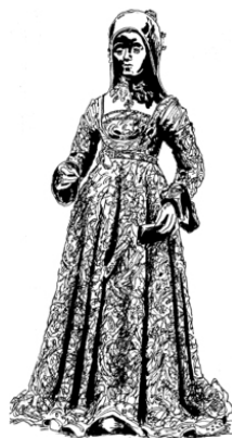
Maria von Burgund (erste Ehefrau)