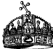
ungarische Königskrone Maria Theresia war König(in) von Ungarn