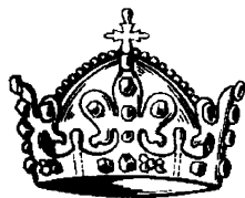
böhmische Königskrone Maria Theresia war Königin von Böhmen