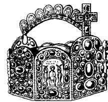
Kaiserkrone bei Franz Stephan von Lothringen und anderen Kaisern zu finden