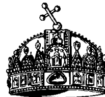
ungarische Königskrone Maria Theresia war König(in) von Ungarn