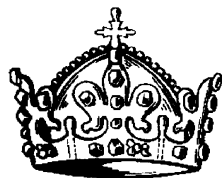
böhmische Königskrone Maria Theresia war Königin von Böhmen