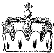
Erzherzogshut Österreich war bis 1804 Erzherzogtum - Maria Theresia war Erzherzogin von Österreich